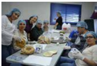
Département Social et Plateau Technique