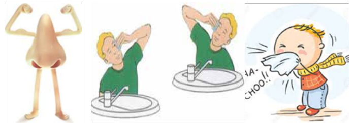
Unite Respiratoire - Plateau Technique