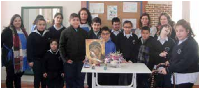
برنامج الدمج المدرسي - سيزوبيل جزين

٢٣ آذار اجتمعنا كلنا ببرنامج الدمج المدرسي واحتفلنا سوا بعيد السيزوبيل. فريق العمل مع ولادنا وست البيت ضوّينا الشموع وصلبنا تا نكتمل مسيرة ال٤٠ سنة بالعطاء والإيمان.