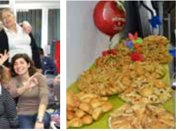
برنامج الإعاقة الجسدية